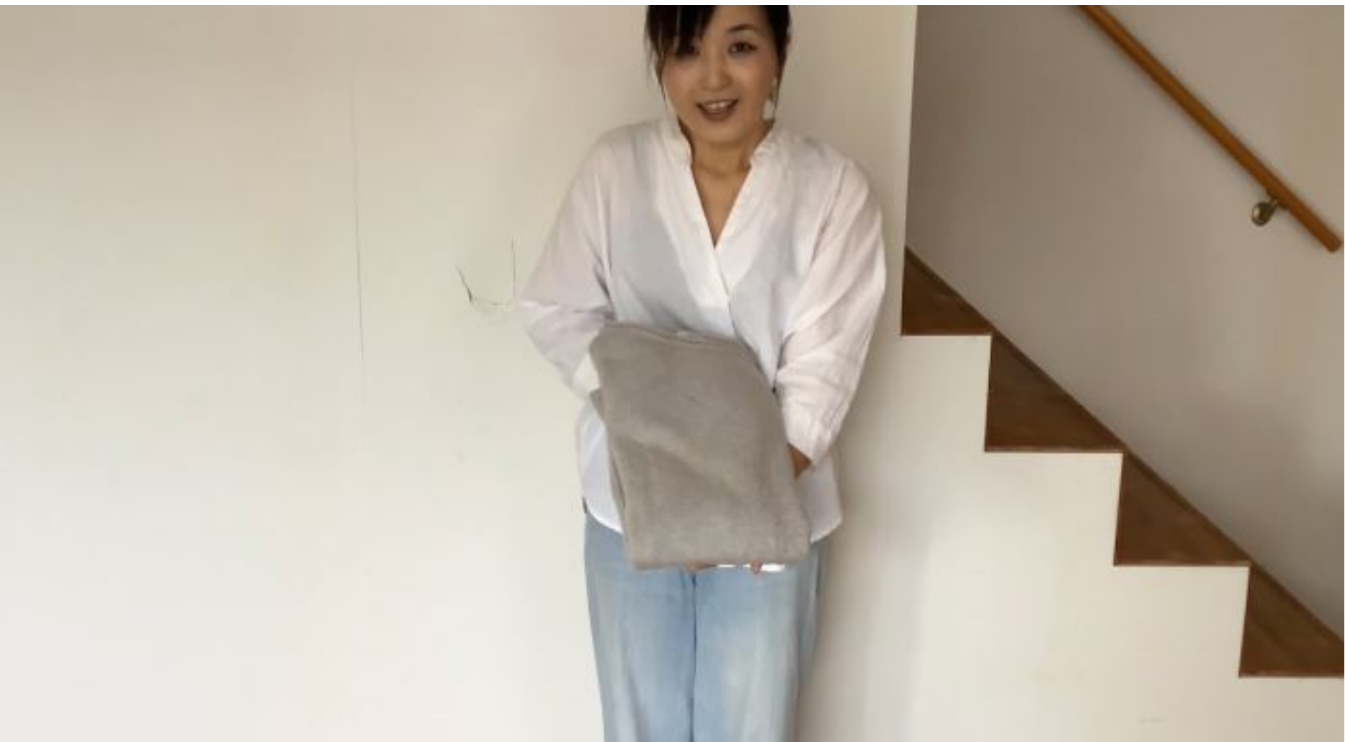
表を向けて、「ショップだたみ」の完成です。