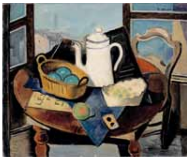
伊原宇三郎<窓際の静物>

美術の新しい見方や楽しみ方を 手に入れることができるかもしれ ません。 この機会にぜひお越しください。