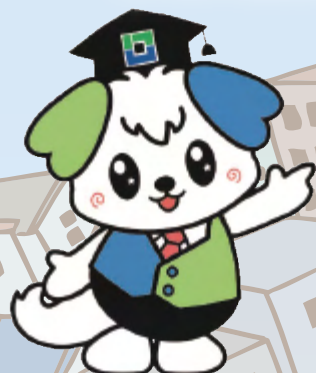
公式マスコットキャラクター なる★ワン

発達障がいのある子どもがいじめ被害の経験が多いことは、これまでも指摘されてきています。本シンポジウムでは、発達障がいのある子どもたちのいじめの実態についてふれながら、いじめを予防するためにはどうすればよいのか、またいじめ被害にあった子どもたちにどのような支援が必要かについて論じることを目的とします。