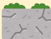
北淡震災記念公園にて Hokudan Earthquake Memorial Park

Hokudan Earthquake Memorial Park・Uzunooka Onaruto Bridge Memorial Hall・Otsuka Museum of Art