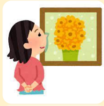
大塚国際美術館 Otsuka Museum of Art