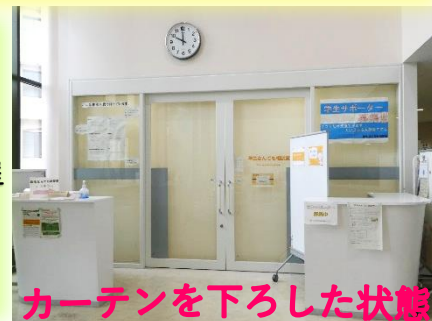
カーテンを下ろした状態