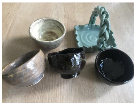
【陶芸作品】高等部の生徒が板作りやひも作りなどの手法で指先をつかって一つ一つ積み上げて完成した作品です。