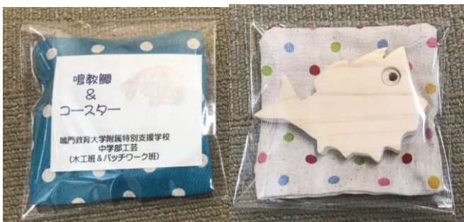
【鳴教鯛&コースター】中学部の木工班で鯛型のマグネットを、パッチワーク班でコースターをつくりました。←