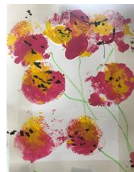
【花】小学部の児童が、風船と綿棒でスタンプしました。色の混ざり方、力の強さ等で表現が違ってくことを楽しみました。北欧デザインのような仕上がりに！