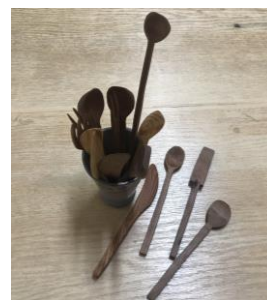
【カトラリー】木工班ではカトラリーづくりに挑戦中です。→