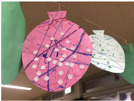
【ヨーヨー】中学部の生徒がビー玉に絵の具をつけ、転がり方を観察・操作して作りました。シールもポイント！