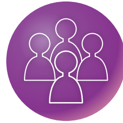
② ミドルリーダー養成分野