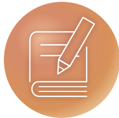
③ カリキュラム・マネジメント分野