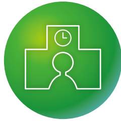
① 学校リーダー養成分野

本コースは、2019（平成31）年度からの大学院改革で誕生した新しいコースです。本コースには、以下の分野があります。