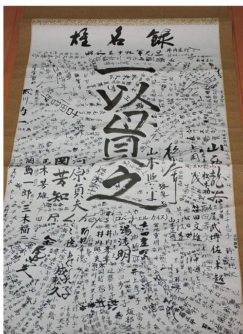
1964（昭和39）年元旦に行われた揮毫式の雄名録