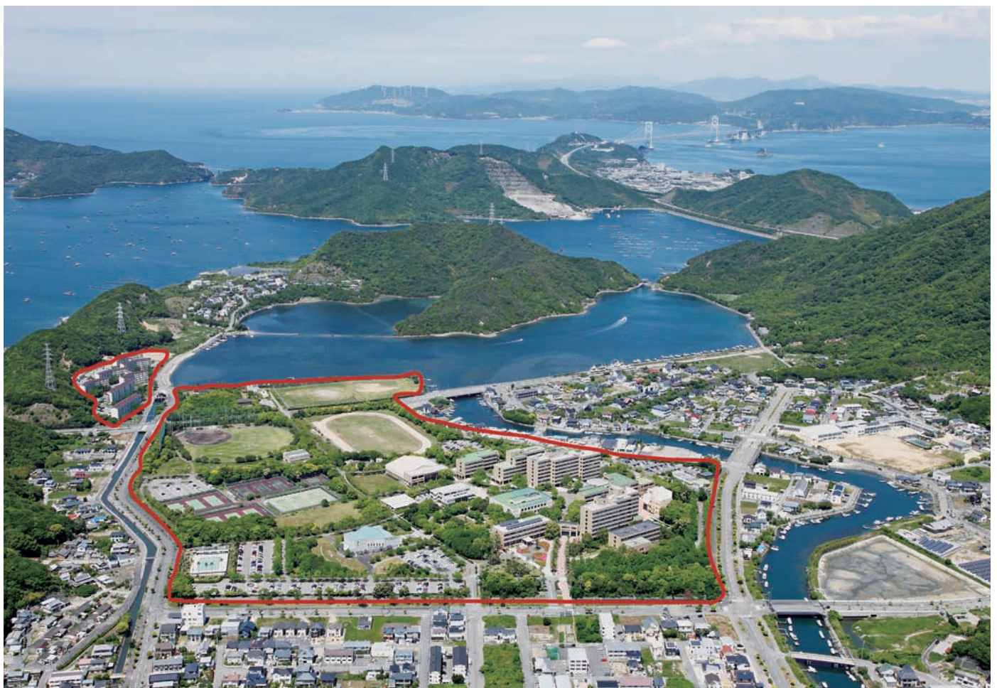
鳴門教育大学全景（瀬戸内海国立公園、鳴門大橋、淡路島を眺む）