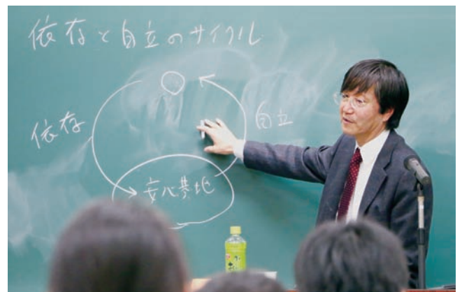
大学院生に特別講義を行う山下学長

例えば、いじめ対策において、教師同士のインフォーマルな話し合いや定期的なセミフォーマルなミーティングなどがあるからこそ、実際何かあった時に協働してフォーマルないじめ防止対策組織が機能するのです。