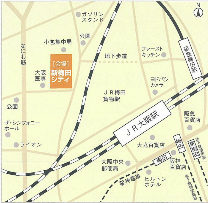
■新梅田シティ周辺俯瞰地図